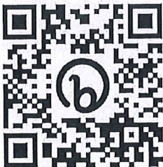
กฎหมายคุ้มครองข้อมูลส่วนบุคคล